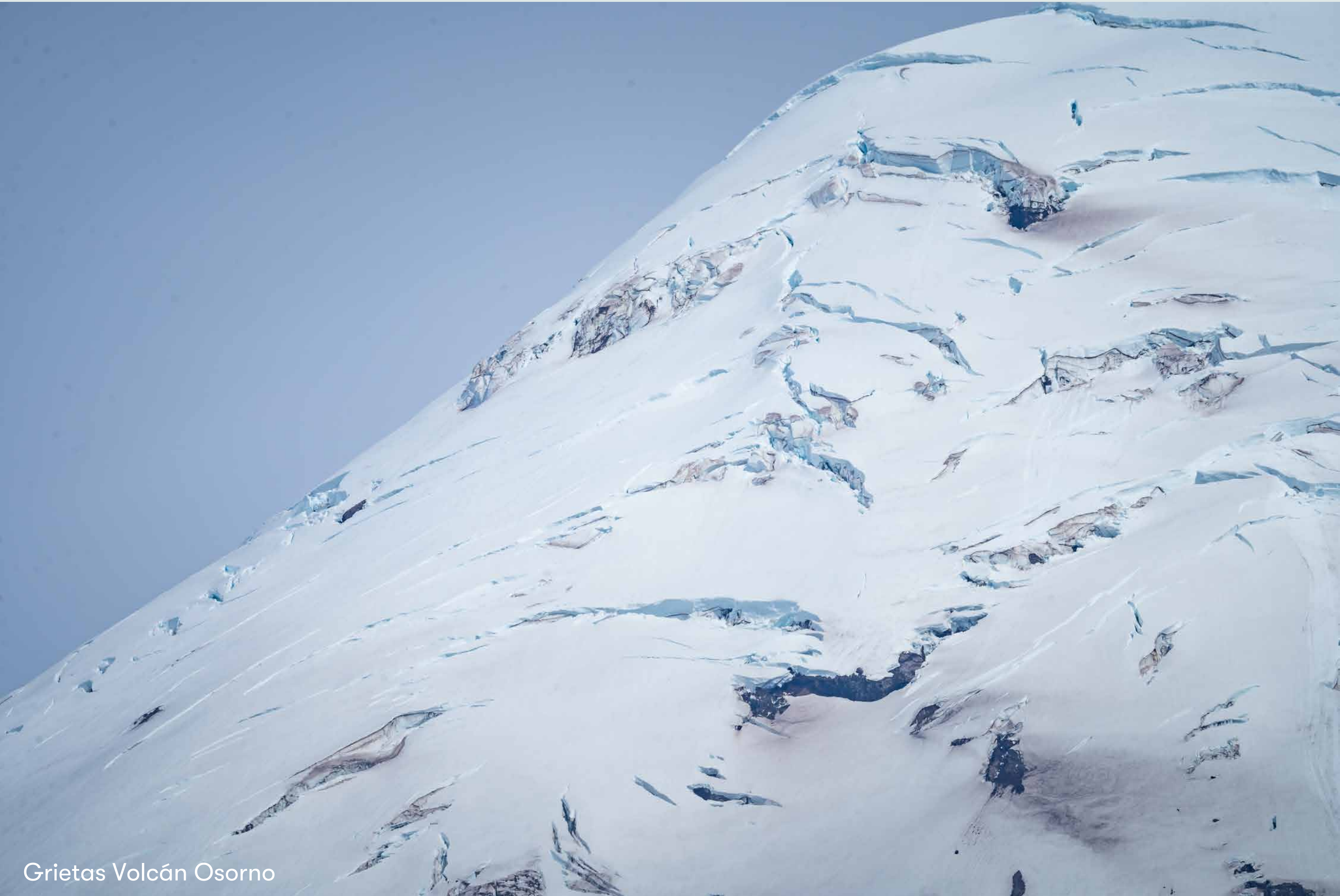
Grietas Volcán Osorno