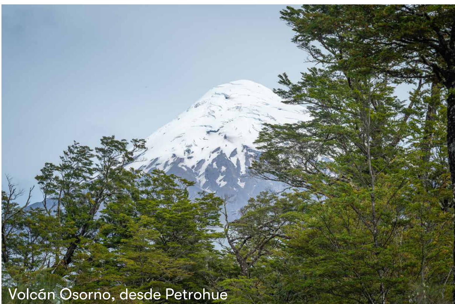
Volcán Osorno, desde Petrohue