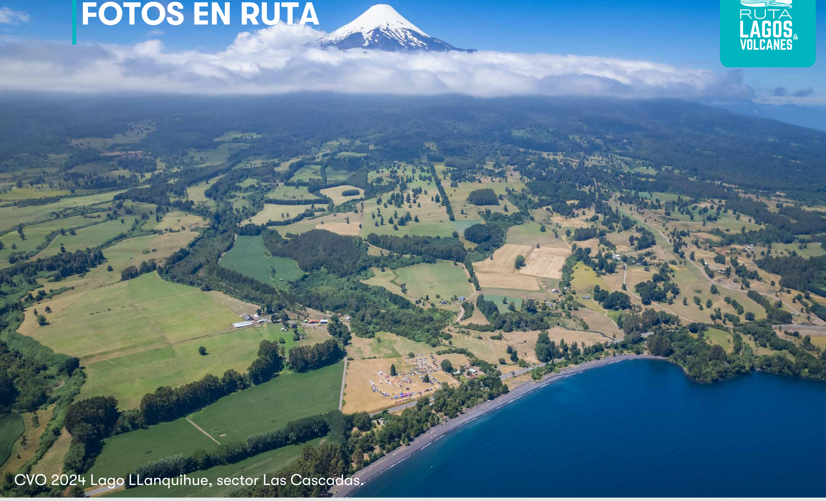
CVO 2024 Lago Llanquihue, sector Las Cascadas.